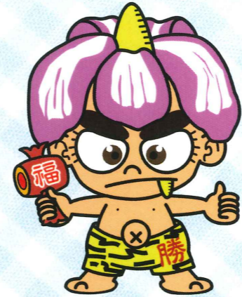
ひょうぶパン鬼一